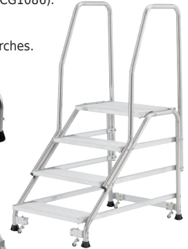
DDCG1089 + options : 2 rampes + kit roues