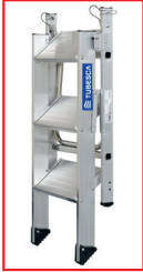
Pliage facile. Ultra compact