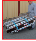
Transport position diable