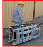
Transport par poignée