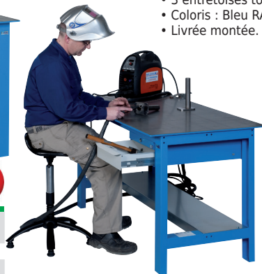
Table de soudage avec options : tiroir et 1/2 plancher métal.