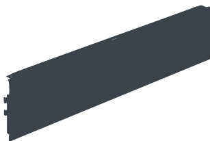
DDEA1330 - Plinthe de finition