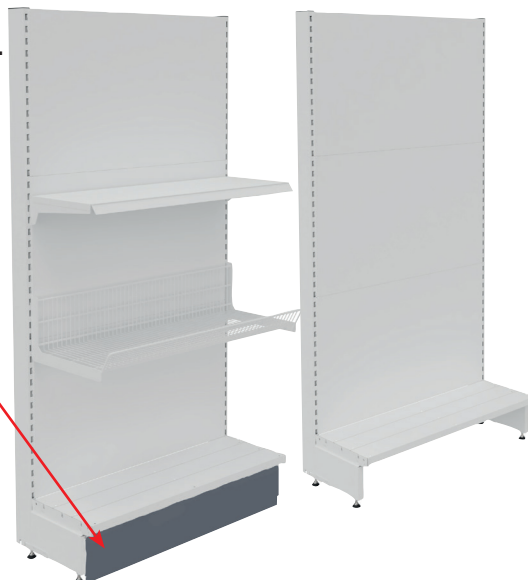
Exemple de présentation : fond lisse, élément départ + plinthes de finition + accessoires