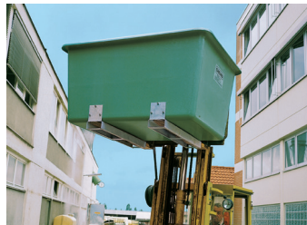
Bac sur socle pour chariot élévateur.