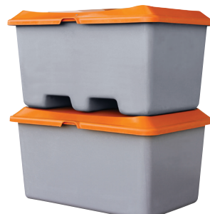
Superposables sur couvercle