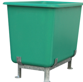
Socle pieds galvanisés, nous consulter.