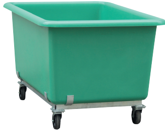
Bac sur chariot 4 roulettes.