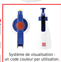
Système de visualisation : un code couleur par utilisation.